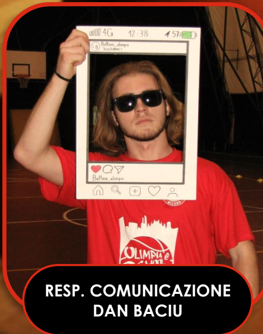
RESP. COMUNICAZIONE DAN BACIU