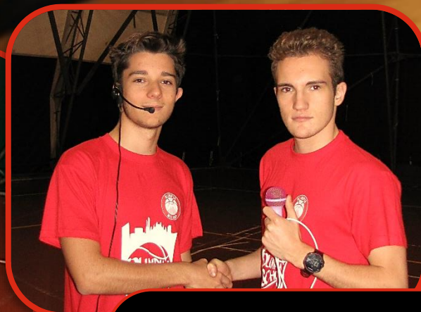
ADDETI STAMPA WALTER CARLI – PAOLO CALVIERI